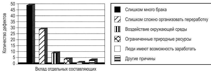
Рис. 23.2. Отчет-гистограмма

Исключить из требований детали, относящиеся к управлению проектом и тестированию, достаточно просто. Но исключение деталей проектирования и реализации обычно гораздо более сложная и тонкая работа. Предположим, что первое требование в табл. 23.1 сформулировано следующим образом: “SR63.1. Информация об обнаруженных дефектах будет предоставляться в виде отчета-гистограммы, написанного на Visual Basic, причем основные причины будут откладываться по осям, а количество дефектов— по оси” (рис. 23.2).