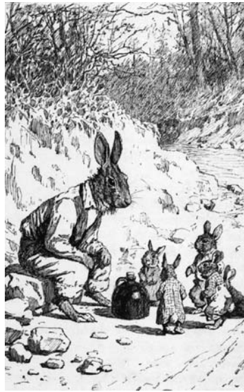
Рис. 1.1. Братец Кролик мог бы дать людям парочку уроков

Миф о братце Кролике полностью вымышлен. История о братце Кролике (рис. 1.1), его проделках и приключениях впервые появилась в печати в 1879 году, в одной из газет Атланты. Это была первая из множества историй о хитром кролике, которому удалось обмануть братца Лиса, братца Волка и многих, многих других.