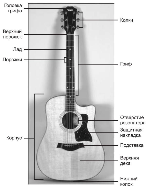
Рис. 1.2. Конструкция типичной акустической гитары