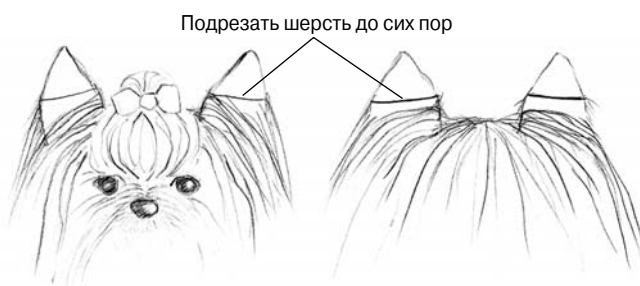
Рис. 10.3. Для стрижки шерсти вокруг ушей используется машинка № 40