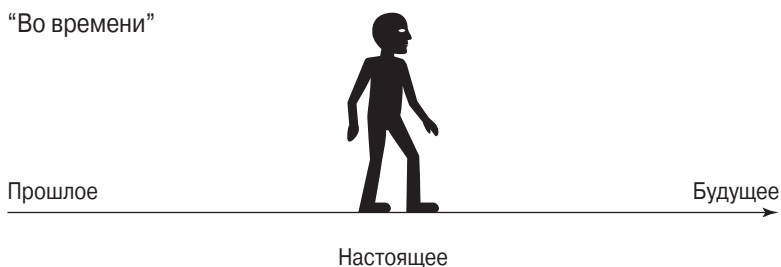
Рис. 13.1. Пример временной оси, расположенной “во времени”

На рис. 13.1 показано, как выглядит прямая временная ось “во времени”. Ось “во времени” также может иметь форму буквы V, на одной стороне которой находится будущее, а на другой — прошлое. Важный момент заключается в том, что прошлое и будущее пересекаются в некоторой точке вашего тела.