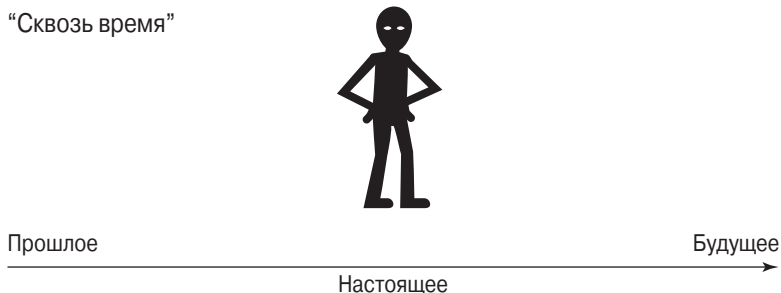
Рис. 13.2. Пример временной оси, идущей “сквозь время”

На рис. 13.2 изображена ось, проходящая “сквозь время”. Обратите внимание: человек стоит на некотором расстоянии от линии, которая не проходит через его тело. Опять-таки, как и в случае оси, расположенной “во времени”, ось, идущая “сквозь время”, может образовывать букву V, которая будет лежать перед человеком, но не касаться его тела.