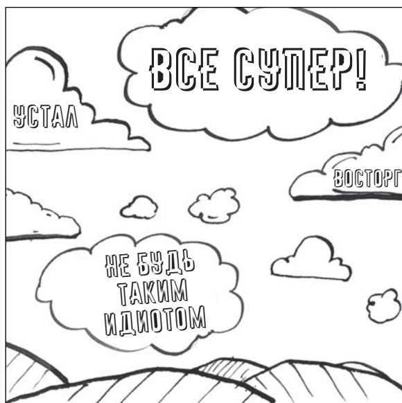
Рис. 8.2. Метафора голубого неба

погружаться в них, но в то же время вы отделены от них. Это суть позиции наблюдателя, или Я-контекста как места действия (рис. 8.2).